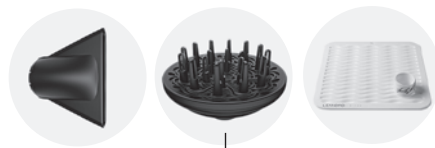
Concentrator, diffuser, and silicone, heat-resistant mat included